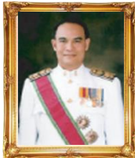
ยศ.ดร.โกศล มีคุณ ผู้ทรงคุณวุฒิ