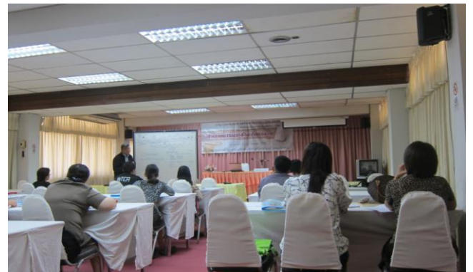
การอบรมเชิงปฏิบัติการเรื่อง “เขียนบทความอย่างไรจึงได้รับการตีพิมพ์”