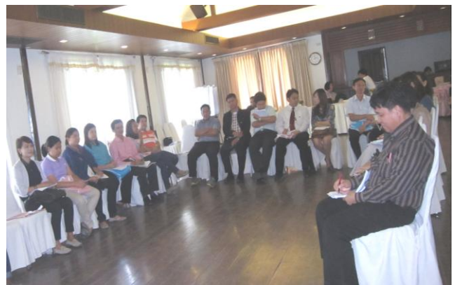
การสัมมนาเชิงปฏิบัติการการจัดการความรู้เทคนิคการเขียนข้อเสนอโครงการวิจัย