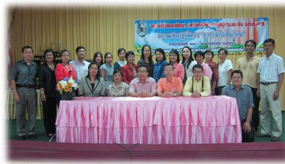
การอบรมเชิงปฏิบัติการการวิจัยชั้นเรียนในระดับอุดมศึกษา