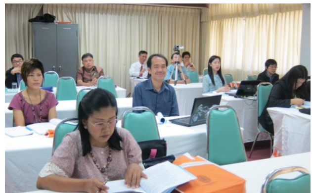
การอบรมเชิงปฏิบัติการการสร้างเครื่องมือสำหรับการวิจัย