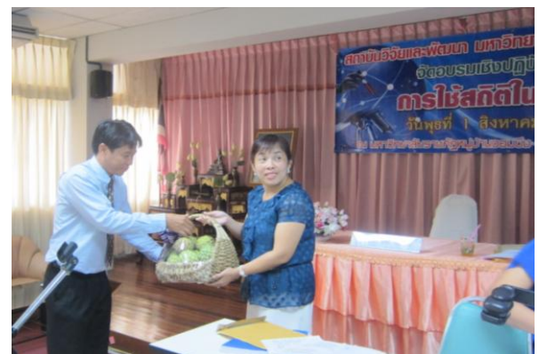
การอบรมการเลือกใช้สถิติสำหรับการวิจัย